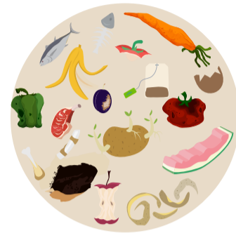
Déchets de cuisine et de table (épluchures, restes de repas...)

Ce sont les déchets non dangereux, biodégradables.