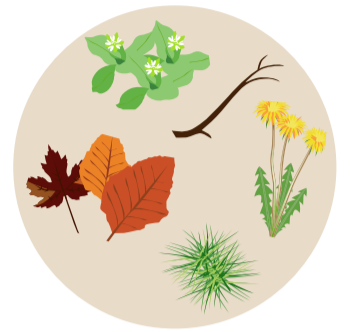
Déchets végétaux (tontes, branchages...)